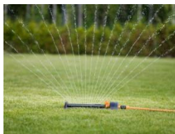
Zraszacz oszczędzający wodę-metalowa podstawa ok. 220 zł