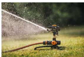
Zraszacz pulsacyjny dookolny on/off - podstawa trójnóg ok. 220 zł