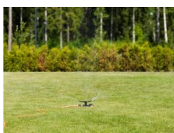
Zraszacz dookolny, metalowy na kółkach ok. 110 zł