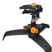
Zraszacz pulsacyjny dookolny on/off - podstawa trójnóg ok. 220 zł