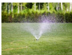
Zraszacz, koło ok. 59 zł