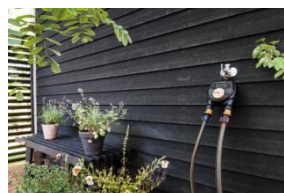
Sterownik nawadniania, podwójny ok. 210 zł